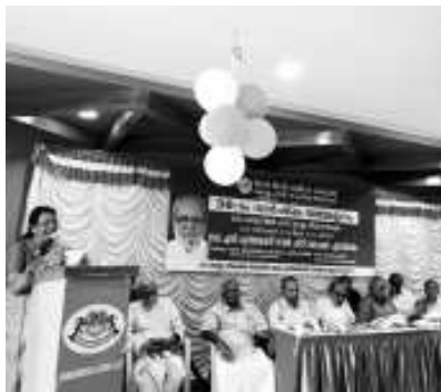
श्रीमती राजपुष्पम आशंसागीत गाती हैं।