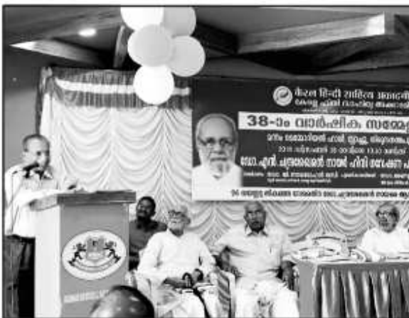
अकादमी के संरक्षक जस्टिस एम.आर. हरिहरन नायर जी अभिनंदन भाषण दे रहे हैं।