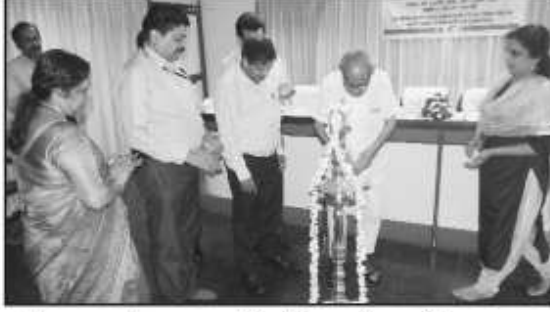
देशरत्न डॉ. नायर जी टोलिक के ८ वाँ पखवाडा समापन समारोह का उद्घाटन दीप जलाते हैं।