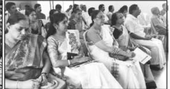
सम्मेलन की शानदार सभा